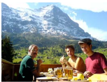
BERGPANORAMA (BILD VOM BALKON)